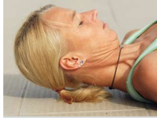
Abb. 1: Vordere Halsmuskulatur – Kopf nur ganz wenig vom Boden abheben und mit Doppelkinn ca. 10-15 Sek. halten.

Da jede Bewegung in der Wirbelsäule das Resultat vieler kleiner Einzelbewegungen mehrerer Wirbel ist, spielen normalerweise Halswirbel und oberer Brustwirbel zusammen, wenn wir unseren Kopf in den Nacken legen. Ist die Beweglichkeit der Brustwirbel aber bereits eingeschränkt, bewegen wenige Halswirbel viel mehr, als für sie gut ist, um die mangelnde Mobilität darunter auszugleichen.