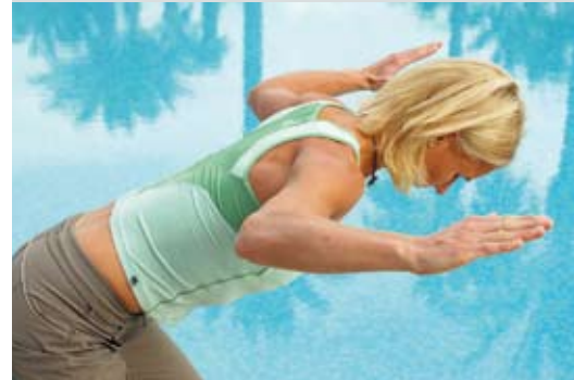
Abb. 2: Kräftigung obere Rückenmuskulatur – Arme und Schulterblätter langsam nach hinten zur Wirbelsäule ziehen und wieder etwas zurück, Schulterblätter nicht zu den Ohren ziehen, Halswirbelsäule gerade halten, leichtes Doppelkinn machen.