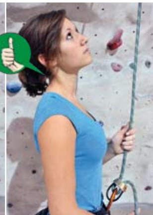
Abb. 8: Richtige Nackenposition beim Sichern