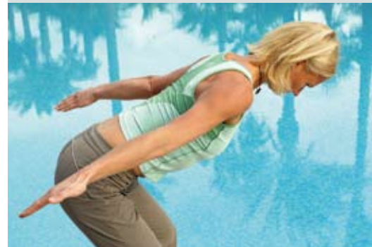
Abb. 3: Kräftigung obere Rückenmuskulatur – Arme gestreckt neben dem Körper halten, Daumen zeigen nach außen, Schulterblätter Richtung Wirbelsäule und Po (nicht zu den Ohren!) ziehen, 3 x 15-20 Sek. halten, Halswirbelsäule gestreckt halten.