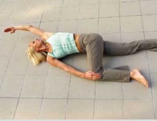
Abb. 5: Drehdehnlage – in beide Richtungen ausführen und in jeder Richtung 10-15 mal ein- und ausatmen!